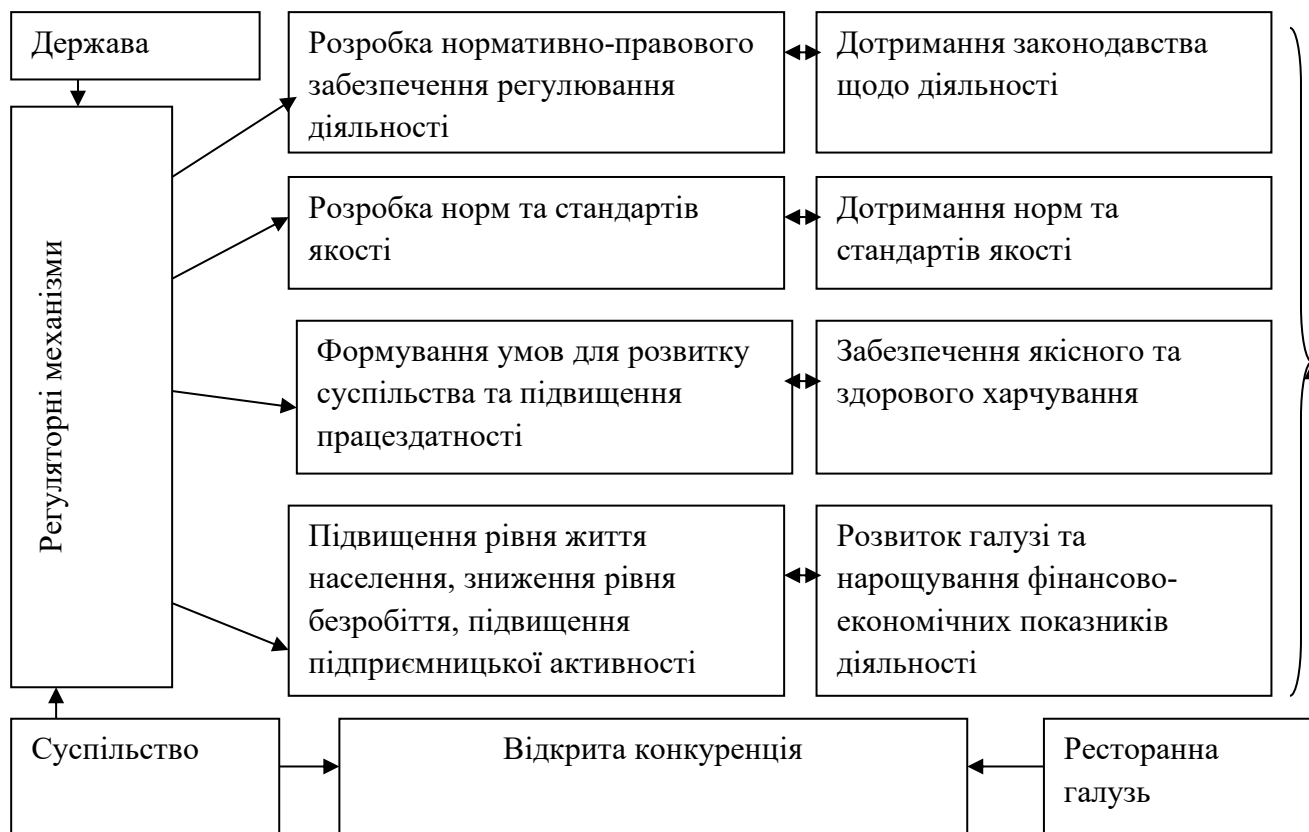
Рис. 2. Модель матриці блоків відповідальності у системі публічно-приватних взаємовідносин розвитку ресторанного господарства