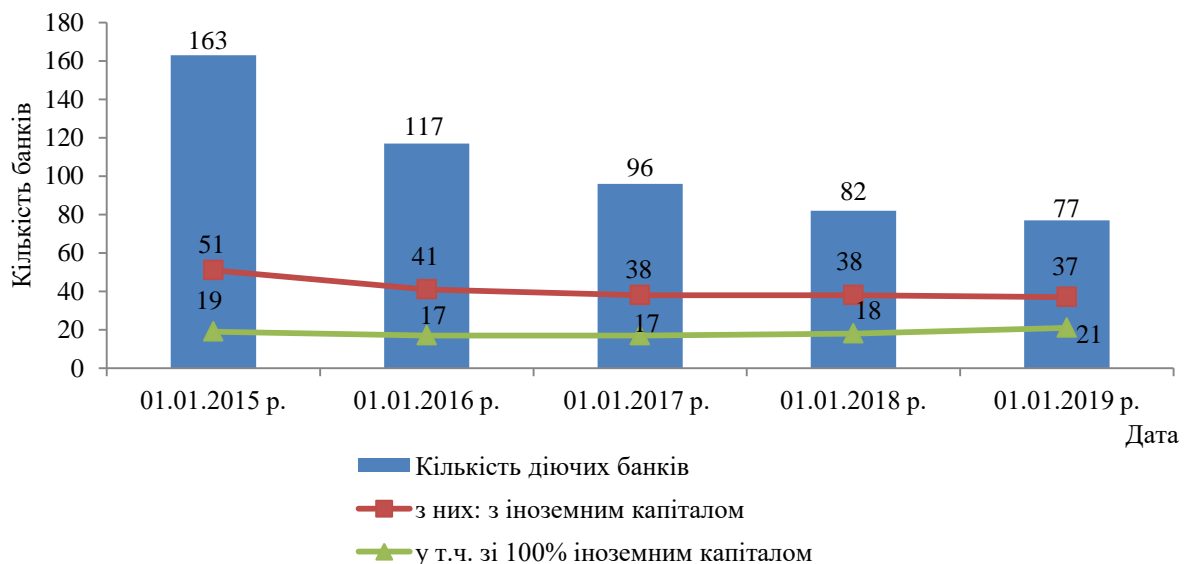
Рис. 1. Динаміка зміни кількості банків з іноземним капіталом України на початок 2015-2019 рр.

Динаміка кількості діючих банківських установ загалом та банків з іноземним капіталом зокрема на початок 2015-2019 рр. зображено на рис. 1.