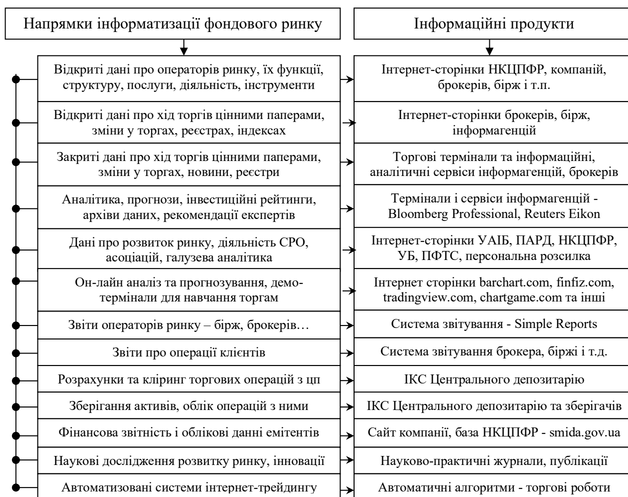
Рис. 1. Діючі інформаційні продукти відповідно інформатизації національного фондового ринку

Як бачимо для потреб ринку та з урахуванням типу інформаційно-комунікаційні системи уже створено та продовжують створювати різні інформаційні продукти для різних цілей, операторів ринку, операцій – від простих обчислювальних програм для підрахунків до комплексних рішень, що включають у єдине ціле різні модулі системи для роботи цілої організації. Їх можна узагальнити наступним чином – Рис. 1.