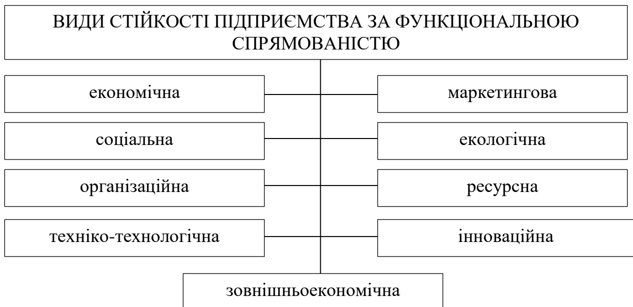
Рис. 1. Класифікація стійкості підприємства за функціональною спрямованістю

Фінансова стійкість підприємства має тісний взаємозв'язок з іншими видами стійкості суб'єкта господарювання. Білик М.Д. [11], за функціональною спрямованістю класифікує наступним чином стійкість підприємства (рис. 1):