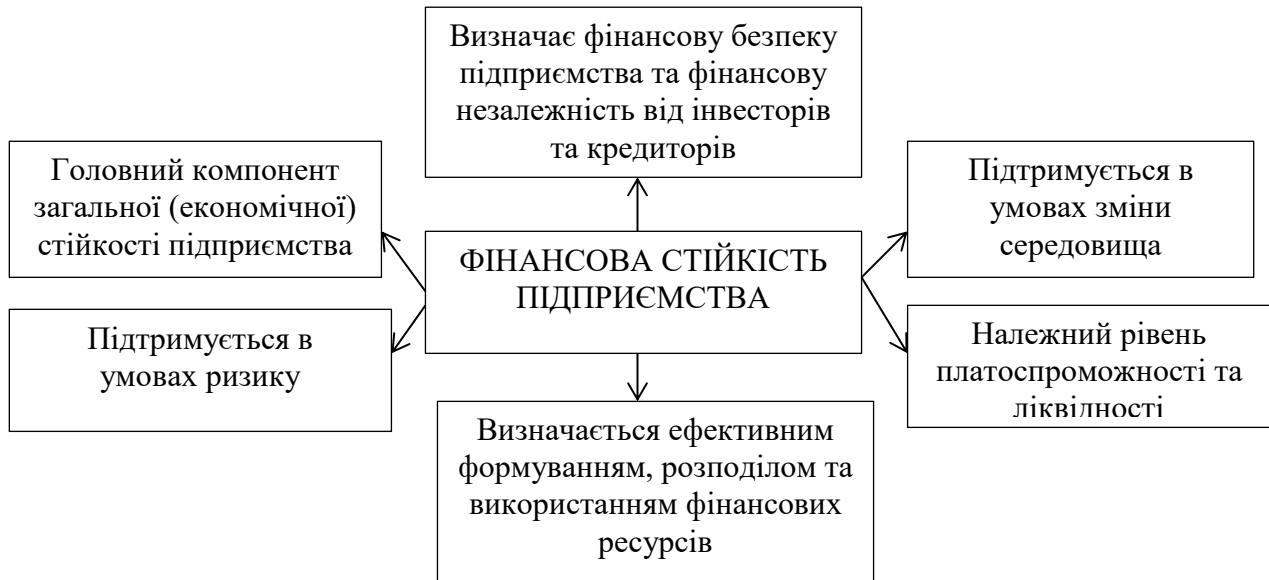
Рис. 2. Основні ознаки фінансової стійкості підприємства

Зважаючи на багатоаспектність категорії фінансова стійкість доцільно обґрунтувати основні її ознаки (рис.2).