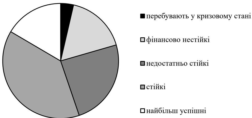
Рис. 2. Структура досліджуваних сільськогосподарських підприємств за характеристикою фінансово-економічного стану, %

Однак, незважаючи на кращі сучасні умови функціонування сільського господарства, у діяльності сільськогосподарських підприємств проявляються різноманітні кризові явища та дестабілізаційні процеси. Так, за результатами дослідження вибіркової сукупності виявлено, що у період з 2014 по 2017 рр. у середньому понад 3,6 % сільськогосподарських підприємств перебували у глибокому кризовому стані, який фактично унеможлиблював їхнє функціонування. Ще 16,9 % були фінансово нестійкими, що значно ускладнювало умови та часто унеможлиблювало провадження ефективної діяльності, а 24,3 % були недостатньо стійкими.