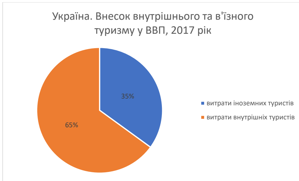
Рис. 1. Структура доходів від туризму та їх вплив на ВВП України, 2017 рік