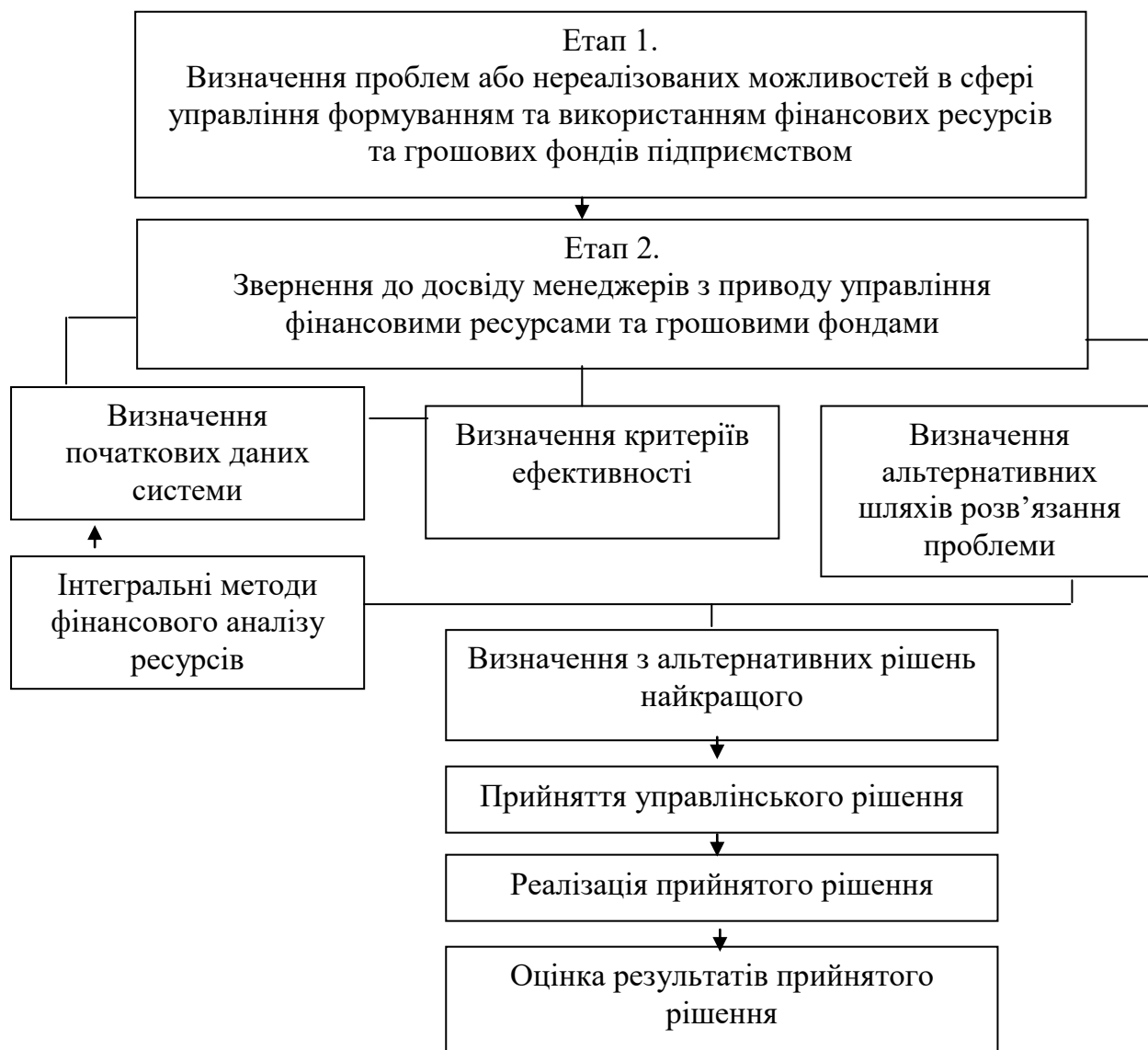
Рис. 3. Етапи підвищення ефективності процесу формування та використання фінансових ресурсів та грошових фондів підприємств в Україні