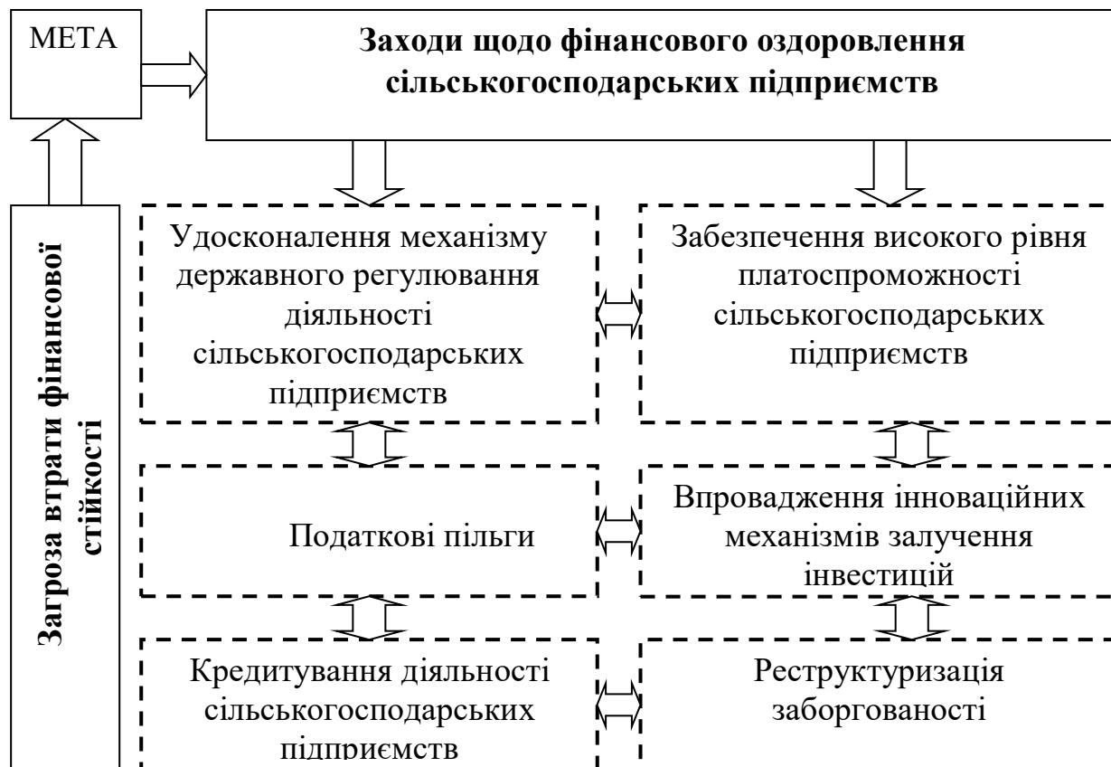
Рис. 2. Схема зниження рівня загрози «втрата фінансової стійкості»

зниження рівня загрози «втрата фінансової стійкості», яка включає заходи щодо фінансового оздоровлення підприємств (рис. 2).