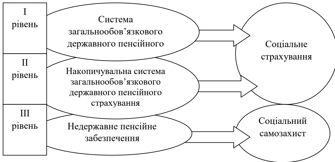
Рис. 2. Приналежність рівнів національної пенсійної системи до елементів системи соціального захисту

адекватним рівнем доходу громадян похилого віку. Приналежність рівнів національної пенсійної системи до елементів системи соціального захисту можна зобразити наступним чином (Рис.2):