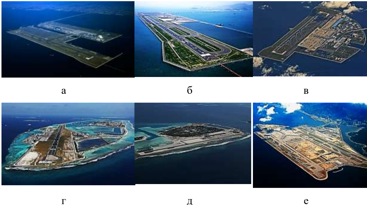
Рис. 1. Аеропорти на штучних островах:

а – Кансай; б – Кітакюсю; в – Тюбу; г – ім.Ібрагіма Насира; д – Маамігілі; е – Гонконгу