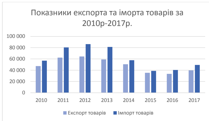
Рис. 4. Динаміка показників експорту та імпорту товарів