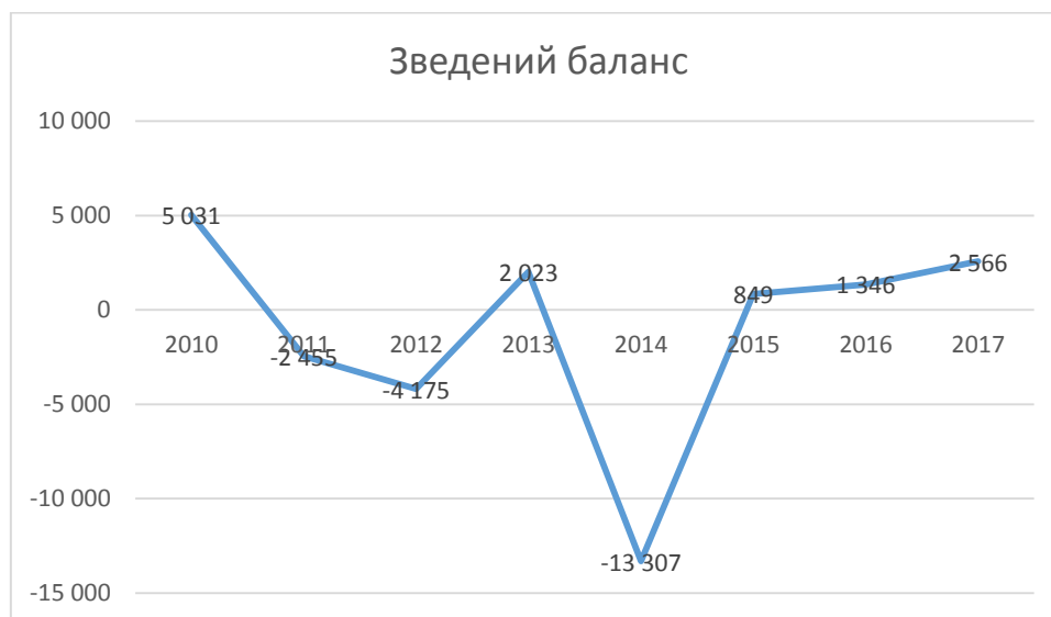
Рис. 1. Динаміка показників зведеного балансу України