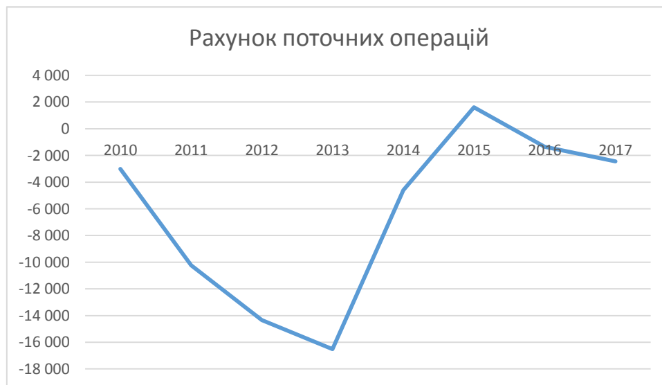
Рис. 2. Динаміка показників рахунку поточних операцій

На стан платіжного балансу суттєво впливає стан платіжного балансу по поточних операціях.