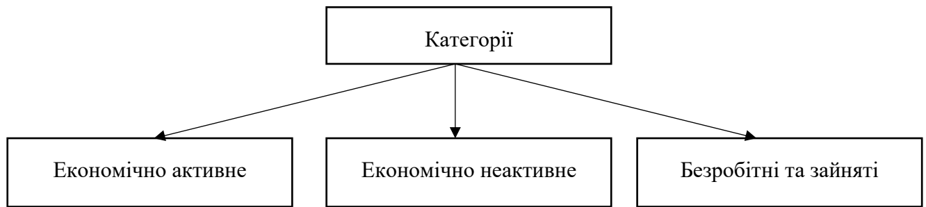
Рис. 1. Категорії, що характеризують ефективність функціонування ринку праці

Фахівці Державної служби України, МОП до економічно-активного населення відносять населення обох статей віком від 15 до 70 років включно, яке впродовж певного періоду часу забезпечує пропозицію робочої сили на ринку праці. Тобто, в структуру економічно-активного населення включено дві категорії – «зайнятих» та «безробітних» осіб. З метою визначення стану сучасного ринку праці України проаналізуємо статистичні дані Державної служби статистики України.