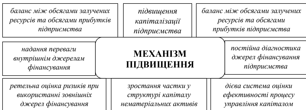
Рис. 2. Систематизація основних механізмів підвищення ефективності структури капіталу підприємства

Відповідно до цього, виокремимо основні механізми досягнення ефективної структури капіталу підприємства, систематизувавши їх, які відображено на рис. 2.