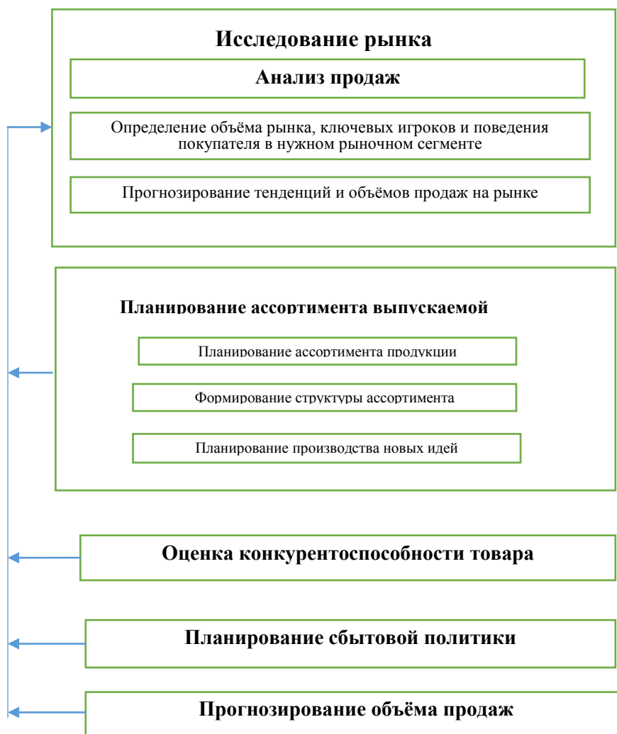
Рис. 2. Комплексное принятие решений по производственному планированию

В дальнейшем каждый элемент рассмотрим более подробно (рис. 2)