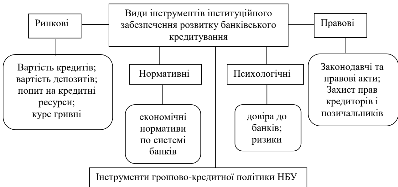
Рис. 1. Інструменти інституційного забезпечення розвитку ринку банківського кредитування

Ринкові інструменти, на нашу думку, є найбільш значимими для банківського кредитування. До них відносять вартість кредитів та депозитів, управління кредитними ризиками, застосування кредитних деривативів як способу мінімізації кредитного ризику, відсоткові ставки за кредитами та депозитами, застосування облігацій як інструменту кредитування великих та середніх підприємств.