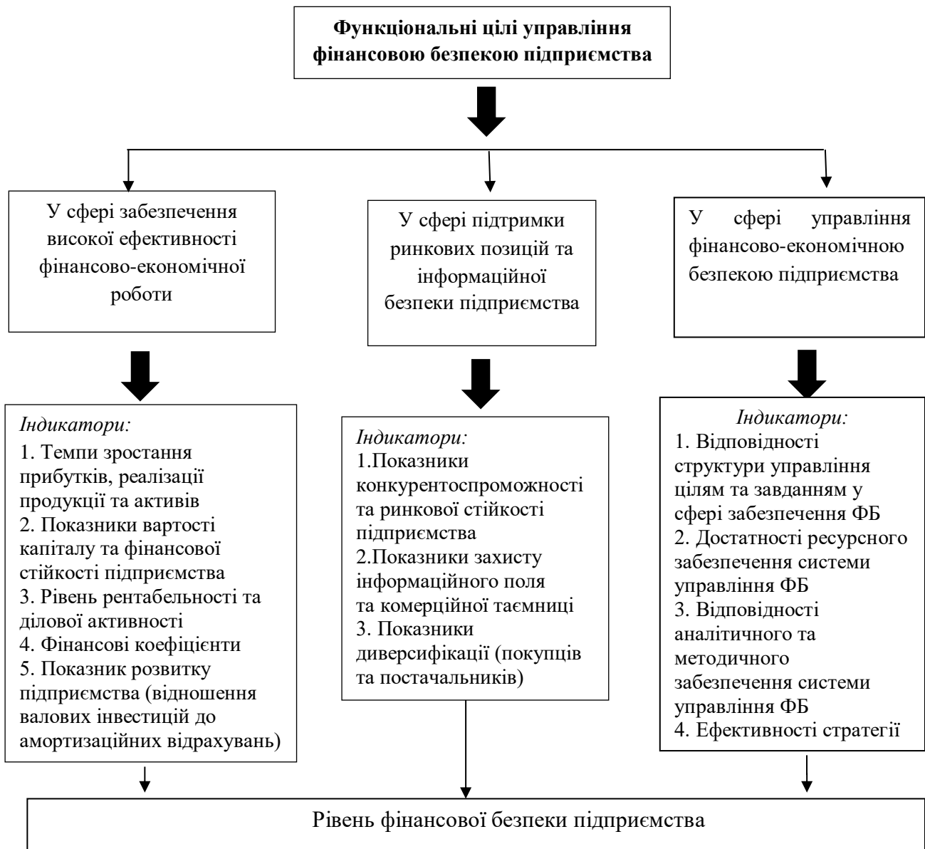
Рис. 1. Система функціональних цілей та індикаторів ефективності управління фінансовою безпекою підприємства

діяльності. З вище зазначеного можна визначити основні цілі управління фінансовою безпекою підприємства, які показано на рис 1.