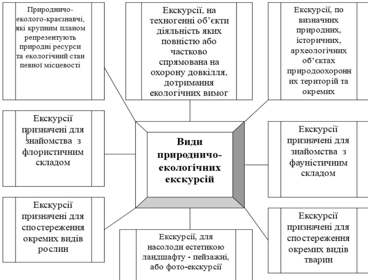
Рис. 1. Види природничо-екологічних екскурсій в залежності від змісту