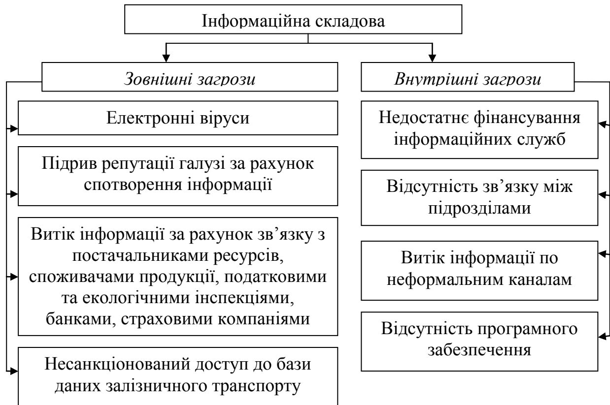
Рис. 1. Схема загроз інформаційної складової

Виникнення мережних комунікацій, що мають на сьогоднішній день глобальний характер, несе в собі і безліч небезпек, пов'язаних з існуванням вірусів, які здатні вивести з ладу будь-яку інформаційну систему за дуже невеликий період часу і завдати великого матеріального збитку.