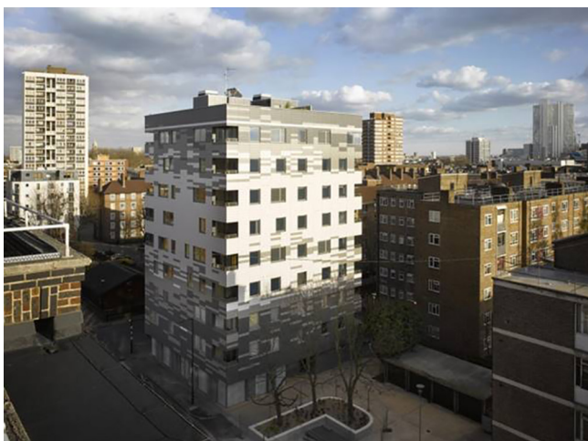
Рис. 2. Здания на улице Мюррей-гроув в Лондоне

На сегодняшний день появилась эта технология и в России, и даже известны случаи использования CLT панелей в строительстве, но пока что это единичные случаи, а не массовые. Проанализировав все достоинства CLT панелей можно сделать вывод, что данный материал является отличной альтернативой деревянного домостроения. На данный момент уже существует множество построек из данного материала.