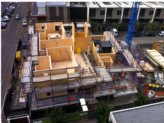
Рис. 1. CLT-панели. Вид строительной площадки

дня на этаж — примерно в таком темпе шло строительство здания на улице Мюррей-гроув в Лондоне (рис. 2). Это один из первых реализованных проектов деревянного домостроения большой высоты (30 метров) в мире.