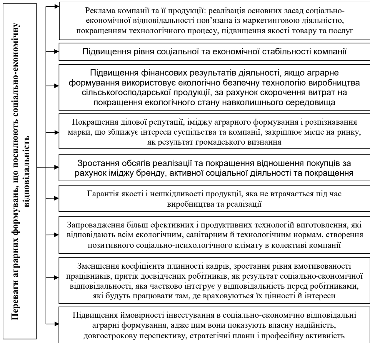
Рис. 3. Переваги аграрних формувань з високим рівнем соціально-економічної відповідальності

Варто зазначити, що аграрні формування, діяльність яких відзначається високим рівнем соціально-економічної відповідальності, є більш конкурентоздатними в ринкових умовах (рис. 3).