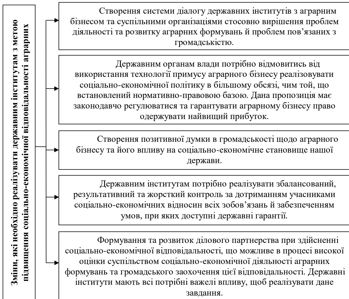
Рис. 1. Участь державних інституцій в підвищенні соціально-економічної відповідальності аграрних формувань

Щоб підвищити соціально-економічну відповідальність аграрних формувань державним інституціям потрібно реалізувати наступні зміни (рис. 1).