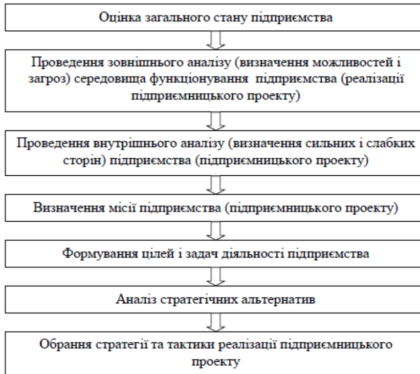
Рис. 1. Стадії бізнес-планування [3, с. 18]

Загальну логіку процесу планування на підготовчій стадії розробки бізнес-плану, як для підприємств нафтової галузі так і для інших підприємств, представимо на рис. 1 . Підготовчий етап тісно пов'язаний та відповідає основним етапам стратегічного планування діяльності підприємства, а відтак стосується: оцінки загального стану (зовнішній та внутрішній аналіз); визначення місії (філософії підприємства); формування цілей та задач діяльності; аналізу стратегічних альтернатив та обрання стратегії.