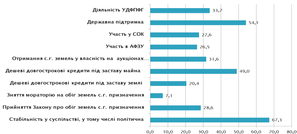
Рис. 1. Важливість зовнішніх чинників для ведення фермерського господарства

Тільки 7,1% опитаних фермерів вважають знаття мораторію на продаж земель сільськогосподарського призначення важливим зовнішнім чинником для ведення фермерського господарства (рис 1). Значно більше, 28,6 % опитаних віднесли до важливих зовнішніх чинників прийняття закону про обіг земель сільськогосподарського призначення.