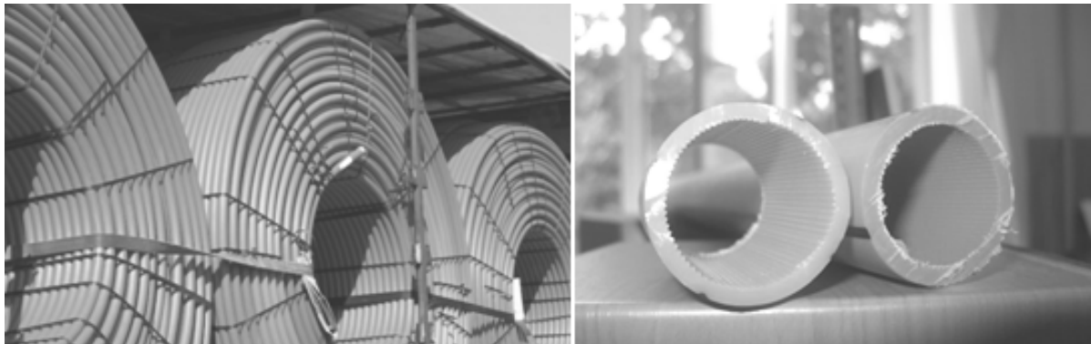
Рис. 2. ЗПТ 40/35, довжина труби в бухті 1750 метрів [2], з ребристою внутрішньою стінкою ООО "РТЗ" [3]

Основними технічними перевагами методу пневматичної прокладки є відсутність зосереджених тягнучих зусиль, що діють на оптоволоконний кабель в процесі його просування по каналу, зведення до мінімуму вимог до працюючих на стиск зміцнювальних покриттів окремих світловодів і їх збірок, економія дефіцитної площі кабельних каналів і можливість заміни розгалужувальних муфт на розгалужувальні муфти трубчатих каналів [4, 330].