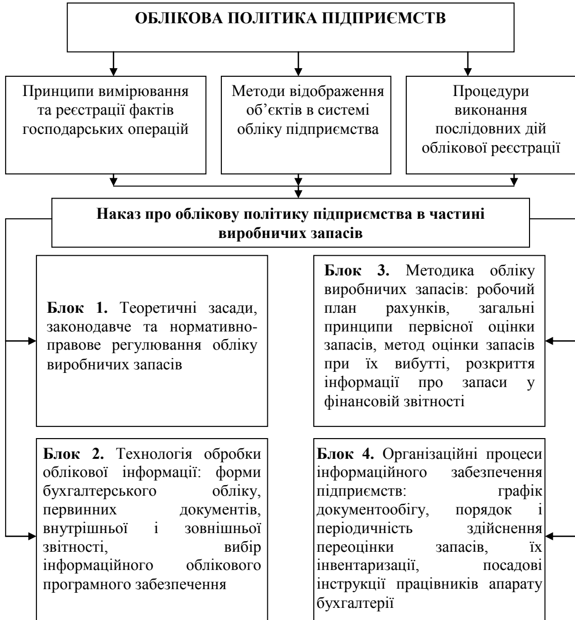
Рис. 1. Структура облікової політики підприємства в частині організації та методики обліку виробничих запасів

Щодо робочого плану рахунків (Блок 3), то він має містити інформацію про перелік рахунків, що використовуються підприємствами у більш деталізованому вигляді порівняно з тим, що наводиться у Плані рахунків бухгалтерського обліку активів, капіталу, зобов'язань і господарських операцій підприємств і організацій. Тобто він має включати тільки ті рахунки та субрахунки, необхідні для відображення господарської діяльності підприємств, враховуючи їх практичні їхні