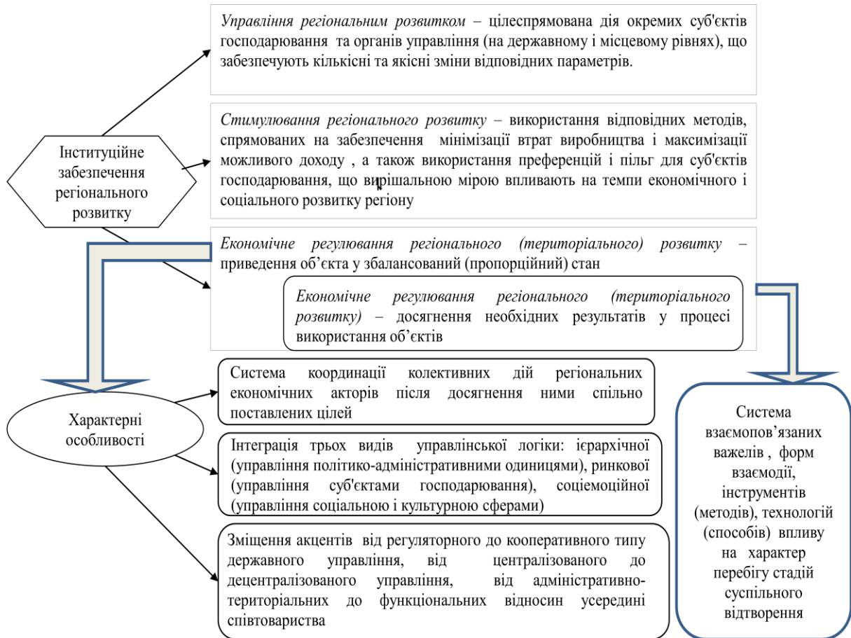
Рис. 1. Сучасний інструментарій забезпечення регіонального розвитку

стимулювання інвестицій в розвинених країнах є прерогативою місцевих органів влади» [1, с. 7].