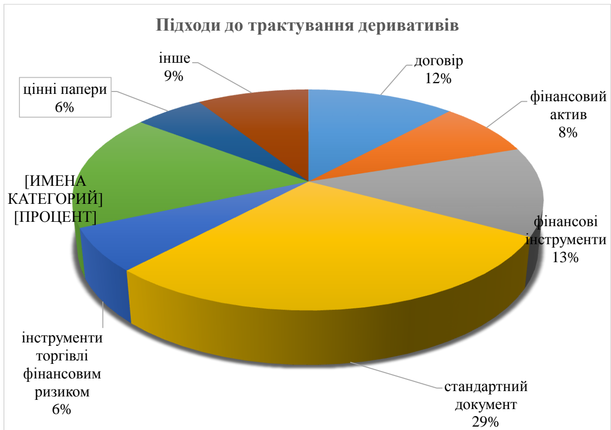
Рис. 1. Підходи до трактування деривативів