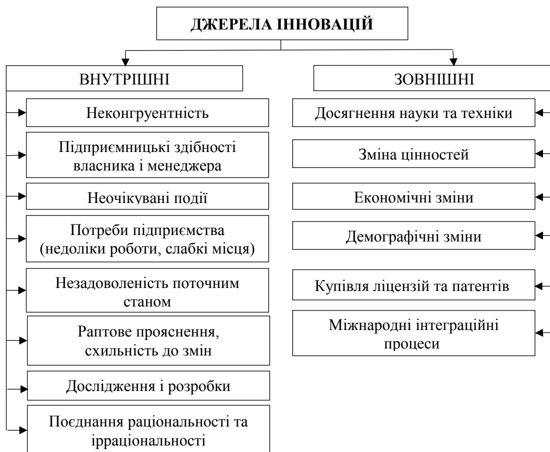
Рис. 2. Класифікація джерел інновацій

Існують різні джерела, що спричиняють інноваційні процеси, та поділяються на зовнішні та внутрішні (рис. 2).