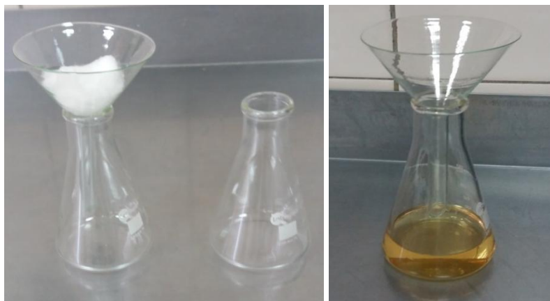
Рис. 1. Фільтрування водно-спиртових настоїв

Матеріали і методи. На першому етапі рослинну сировину подрібнювали до розмірів 3x3 мм, поміщали наважку 4 г в скляні флакони, заливали 100 мл спиртовмісного розчинника з об'ємною часткою спирту 40 %. Флакони закривали кришками, поміщали в сухоповітряний термостат на 48 год. при температурі 40 °С. Отримані настої охолоджували до температури 20 °С та фільтрували (рис. 1).