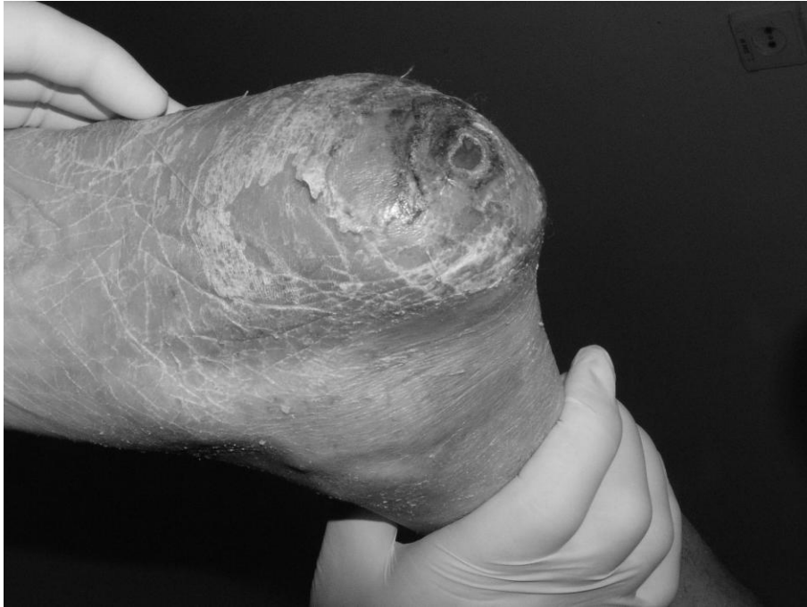
Рис. 4. Загоєний пролежень II стадії лівої п'ятки після первинної санації у хворого Б-ва, 65 років. Стан після компресійного зламу 11 грудного хребця

незначній мірі. Критерієм ефективності догляду та лікування було зменшення ексудації з наявністю крайової епітелізації (рис. 4), та (або) формування кірки.