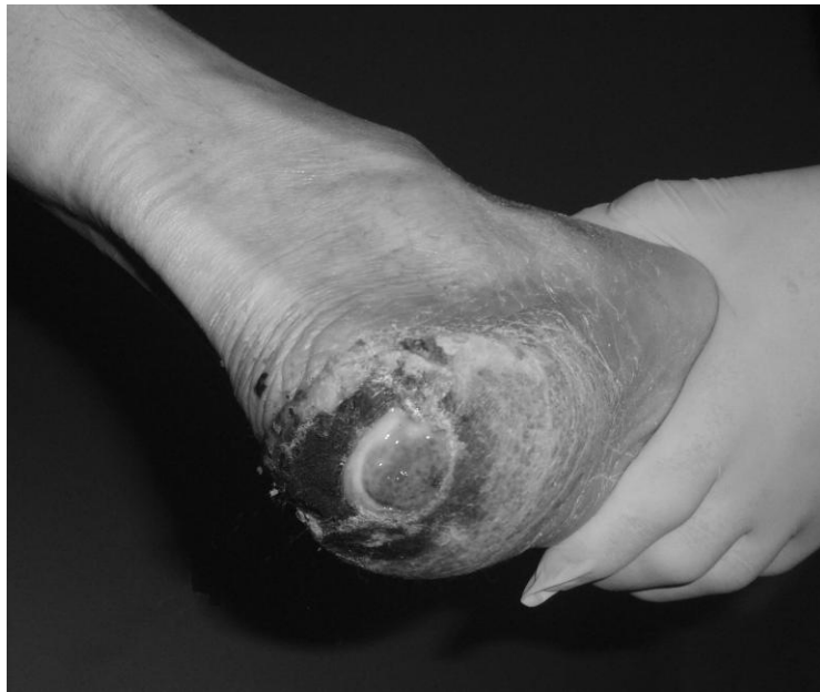
Рис. 3. Пролежень II стадії лівої п'ятки після первинної санації у хворого Б-ва, 65 років. Стан після компресійного зламу 11 грудного хребця

водню, 1% розчином полівідону йоду та підсушування стерильними сухими марлевими салфетками, після чого здійснювали присипання підготовленої патологічно зміненої поверхні екстемпорально приготованим адсорбуючим та антибактеріальним засобом у формі присипки, що містить у своєму складі порошкоподібний клиноптилоліт з адсорбованим дегідратованим та деетанолізованим випарюванням фукорцином. Накладали асептичну пов'язку.