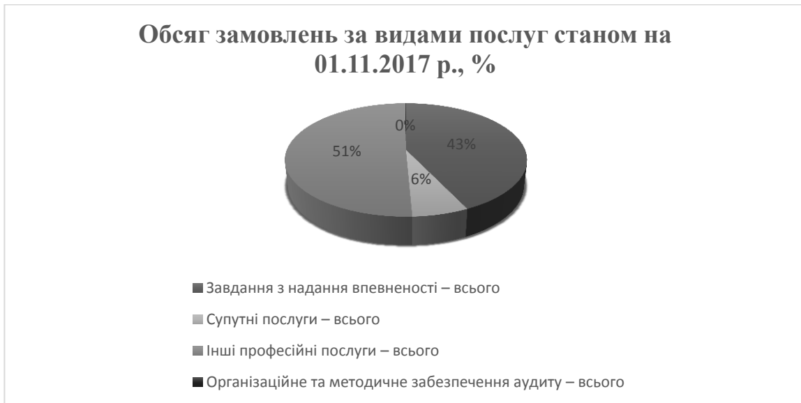
Рис. 3. Обсяг замовлень за видами послуг станом на 01.11.2017 р.,%

Існує певна структура наданих аудиторських послуг станом на 01.11.2017 рр. (Рис. 3).