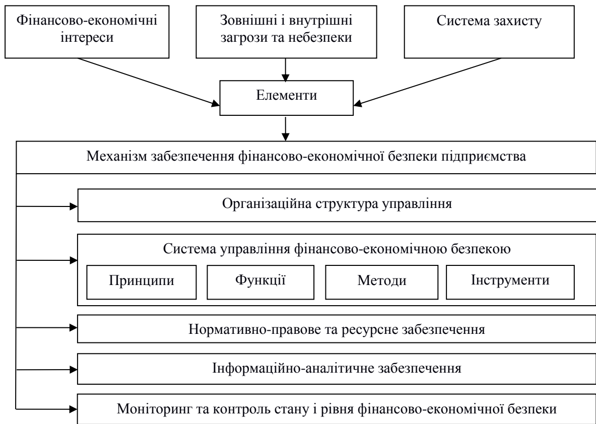
Рис. 2. Структурі механізму забезпечення фінансово-економічної безпеки підприємства (розроблено авторами на основі [7, ст. 208; 8, ст. 193])

Організаційна складова управління фінансово-економічною безпекою підприємства передбачає склад і підпорядкованість різних елементів, ланок і рівнів управління фінансово-економічною безпекою та наявність необхідного персоналу, наділеного відповідними повноваженнями щодо управління фінансово-економічною безпекою. Структуру механізму управління фінансово-економічною безпекою наведено на рис. 2.