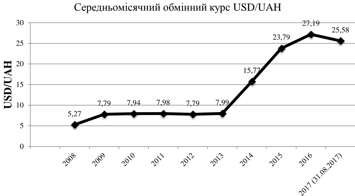
Рис. 2. Динаміка зміни валютного курсу USD/UAH в Україні у 2008- 2017 рр. [1]

Якщо врахувати обмінний курс, то на даному прикладі яскраво виражено вплив обсягів державного зовнішнього боргу в національній валюті України на валютний курс. Якщо до 2014 року обмінний курс USD/UAH був стабільним, то і рівень заборгованості України збільшувався пропорційно як в гривнях, так і в доларовому вираженні. Починаючи з 2014 року валютний курс різко змінився (з 15,77 у 2014 році до 23,79 у 2015 році), при чому в негативному напрямку для нашої держави, причиною чого стало збільшення обсягу зовнішнього боргу на декілька мільярдів доларів США, але у гривневому еквіваленті ці показники відрізняються на декілька сотень. І не дивно, що відразу виникає логічна думка, що зміна обмінного курсу обумовлена зміною зовнішнього боргу держави, особливо у розрізі національної валюти.