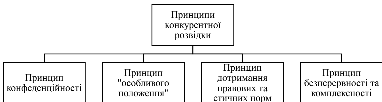
Рис. 1. Основні принципи конкурентної розвідки

На нашу думку, ефективність конкурентної розвідки значною мірою залежить від дотримання її основних принципів, як невід'ємного елементу фінансово-економічної безпеки підприємства. Тому ми пропонуємо наступні принципи конкурентної розвідки, які наведені на рис.2.