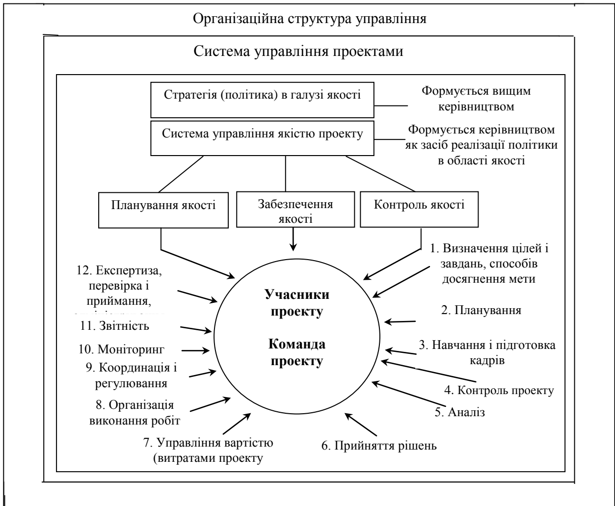
Рис. 2. Вплив і інтеграція системи управління якістю проекту на організаційну структуру управління [2]

структуру цілей і завдань, соціально-психологічні аспекти управління проектами. Однак при розробці організаційної структури управління мало уваги приділяється якості даної структури.