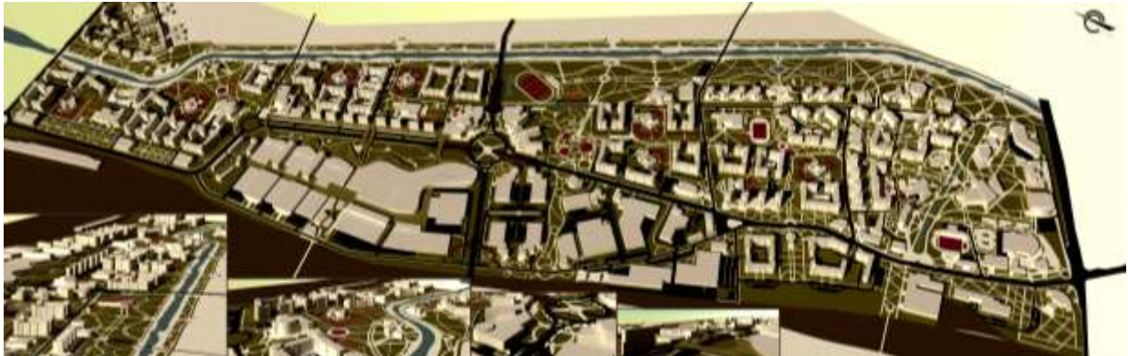
Рис. 3. Інноваційний розвиток Іванівського промислового району м. Харкова

обмежень, розвитку транспортної інфраструктури і інженерного забезпечення.