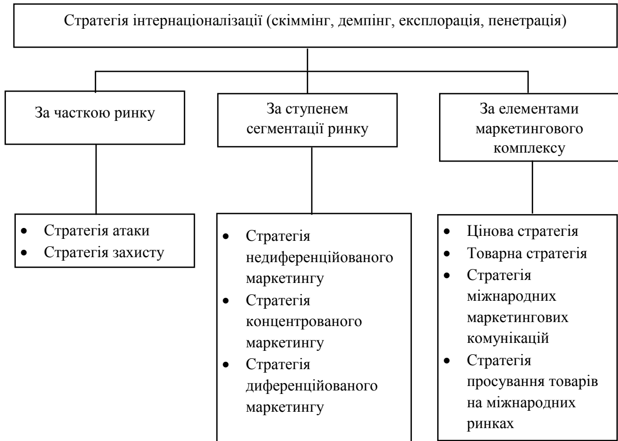
Рис. 2. Стратегії ЗЕД підприємства [7, с. 73]

мінімальним ризиками з боку керівництва компанії, але при цьому сума грошових надходжень від продажу товарів збільшується, хоча товари і реалізуються за низькими цінами.