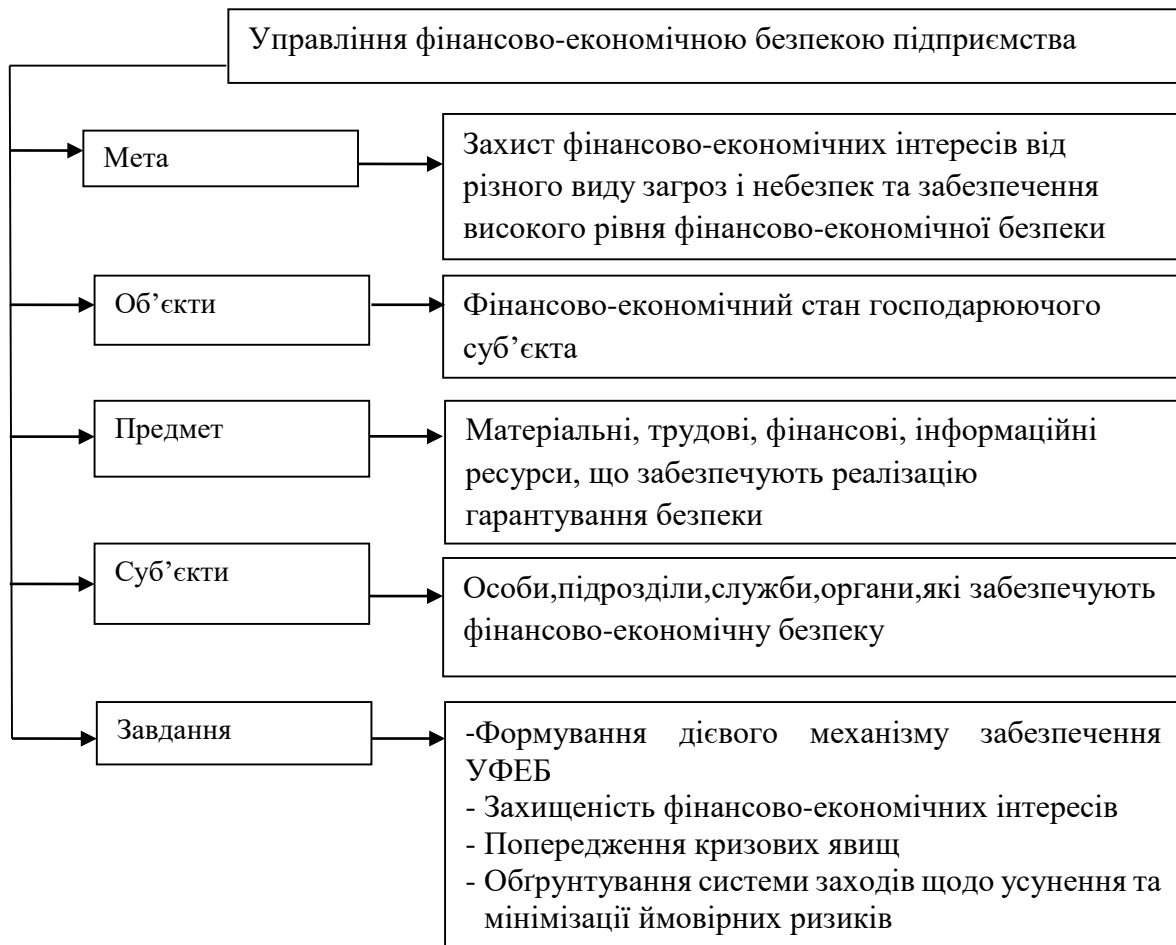
Рис. 1. Узагальнені складові управління фінансово-економічною безпекою підприємства [2]

Слід зазначити, що від управління фінансово-економічною безпекою залежить які методи, інструменти та завдання буде обрано для фінансово-господарської діяльності підприємства. Механізм управління фінансово-економічною безпекою підприємства повинен містити в собі такі складові як: