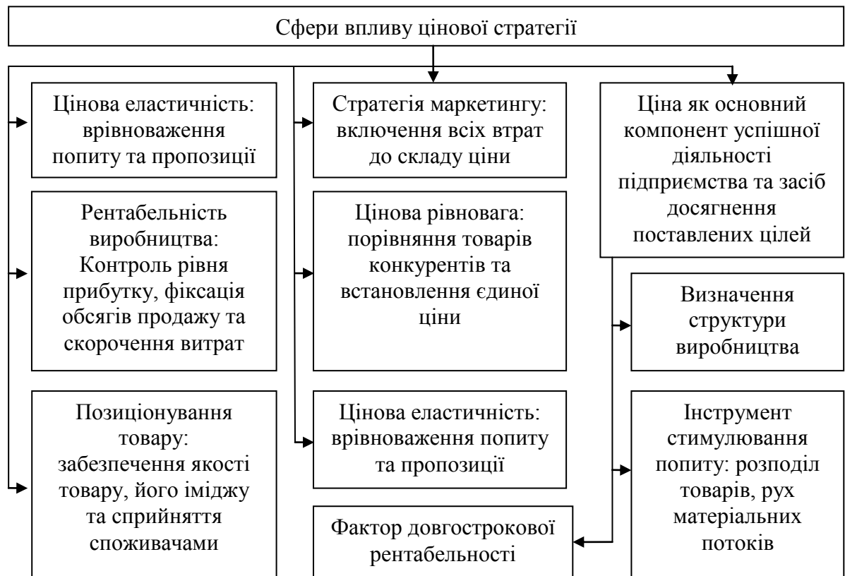
Рис. 1. Сфери впливу цінової стратегії