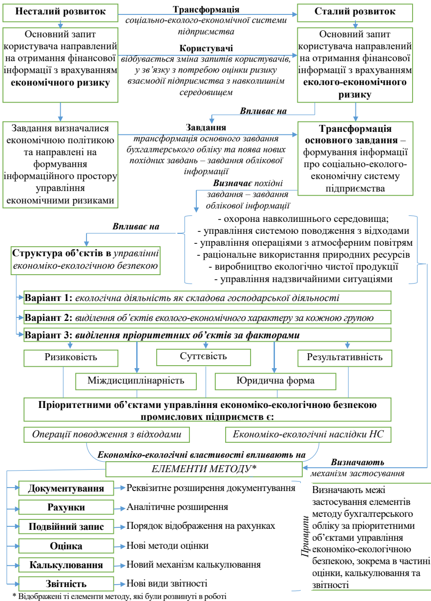
Рис. 1. Теоретико-методологічна конструкція бухгалтерського обліку в управлінні економіко-екологічною безпекою підприємств