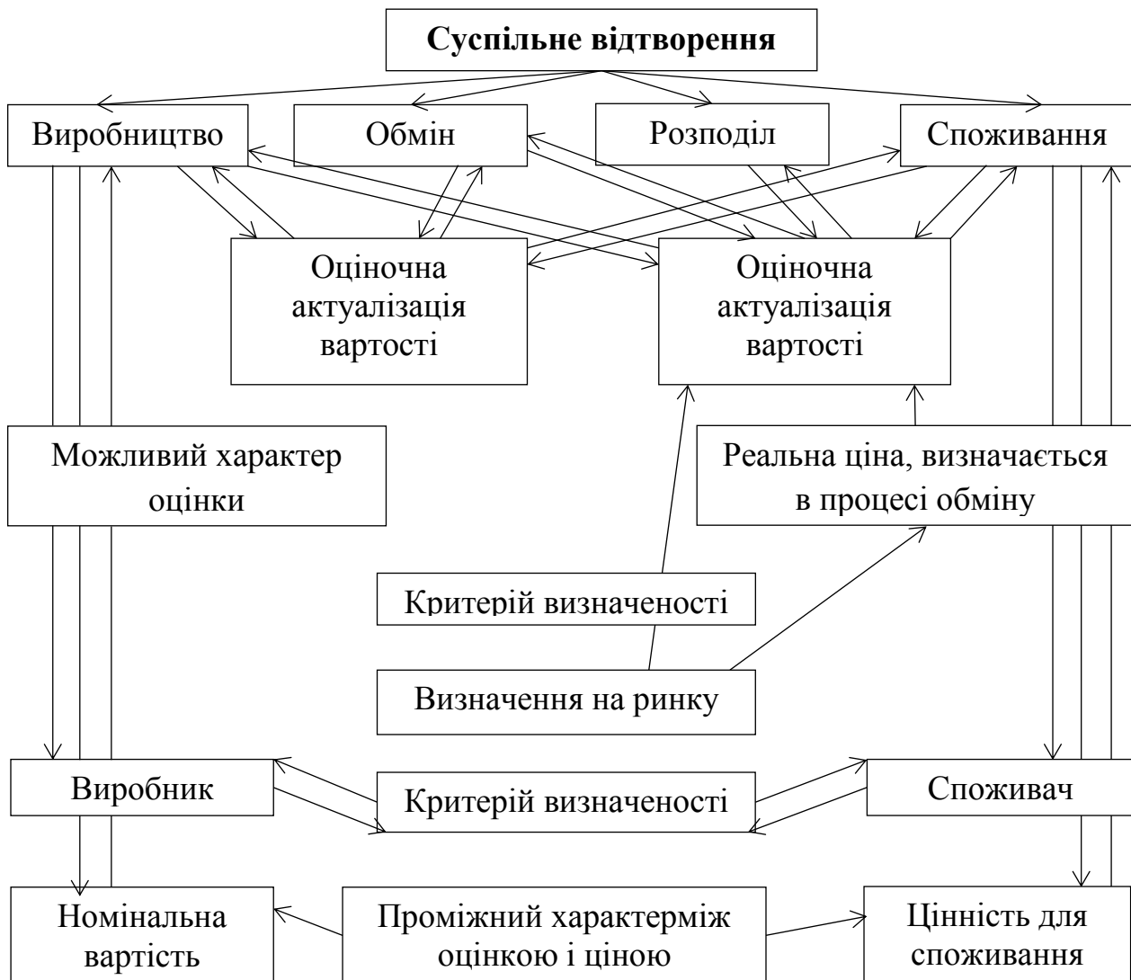
Рис. 2. Актуалізація вартості, що формується в процесі взаємодії чотирьох сфер суспільного відтворення

в) калькулювання собівартості продукції (товару або послуги).