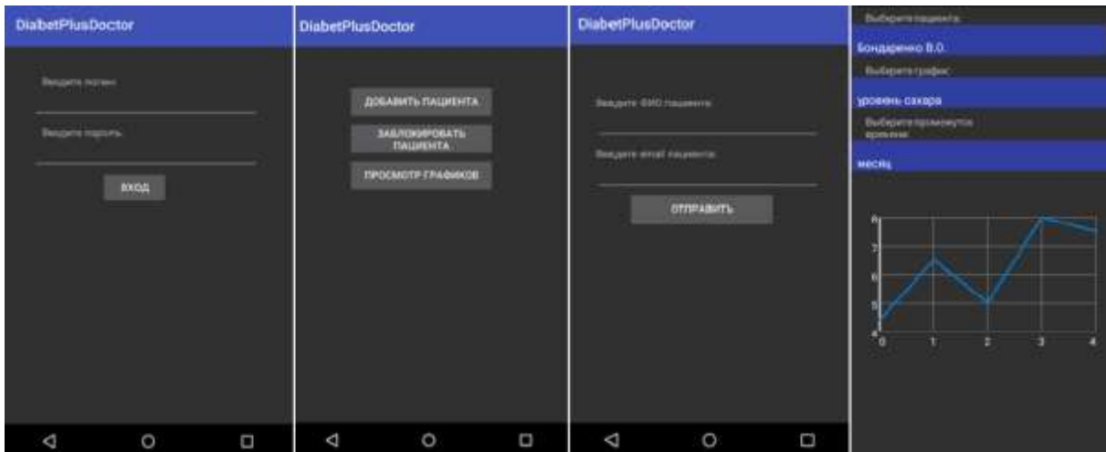
Рис. 1.3 Мобільний додаток для лікаря (розробка автора)