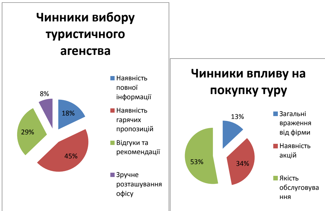
Рис. 1. Чинники вибору туристичного агенства та покупки туру

Визначено, що продаж туру у найбільшій мірі залежить від якості роботи консультанту (53%), від того, наскільки він правильно реагує на потреби клієнта, швидко підбирає цікаві пропозиції, демонструє візуальні матеріали (відео та фото файли різних готелів, екскурсій тощо), наскільки він ввічливий та привітний. Однак окрім якостей консультанту важливим для клієнта є наявність акцій, які можуть додатково мотивувати клієнта до купівлі туру саме у цій туристичній фірмі та не шукати аналогів у інших (34%).