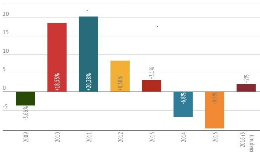
Рисунок 1. Валовий внутрішній продукт України за 2009-2016 рр.

Податкова система України побудована в основній мірі за фіскальними принципами. В ній майже відсутні засади регулюючого та стимулюючого характеру, які створюють сприятливі умови для зростання економічної активності суб'єктів господарювання та економіки в цілому. Це зумовлює потребу в її реформуванні, що б дозволило поєднати фіскальну та стимулюючу її функції. Зміни в сфері оподаткування мають проводитись докорінні, в тому числі і перегляд кількості податків та податкових платежів. Основними орієнтирами в зміні системи оподаткування мають бути її простота, зрозумілість та достатня бюджетна наповнюваність.