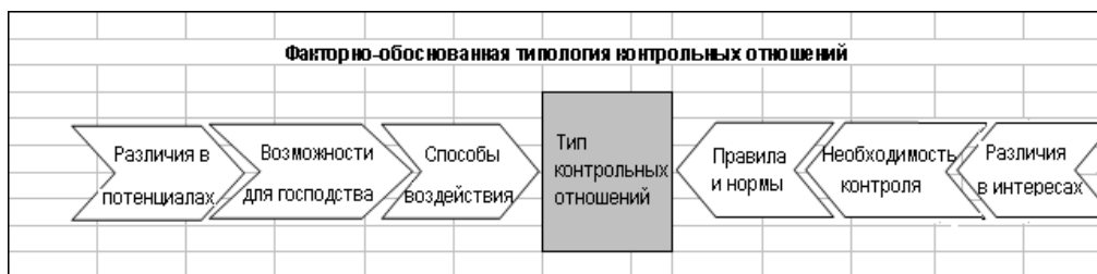
Рис.2. Тип контрольных отношений

Из описанного выше можно сделать вывод, что анализ специфики, проявленной на различных этапах процесса, является особым выражением и конкретным проявлением двусмысленности 5 единного контрольного отношения - как критичного отношения и как отношения господства и подчинения - предоставляет возможность типологизации этого контрольного отношения в различных организациях, а также в период их развития 6