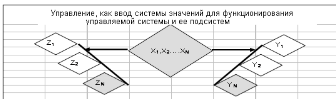
Рис.4. Управление как система значений

возможности каждой структуры ставить цели, организовывать, проверять и регулировать их выполнение. Структура, при необходимости, содержит контрольную функцию, которая определяет поведение системы и ее возможность развиваться в строго определенных параметрах до достижения цели. В этом контексте, возможно, наиболее удачным является определение: Управление может быть определено как установление конкретной системы значений, определение нормы X_1, X_2, \dots, X_N параметров функционирования управляемой системы, как система значений, Y_1, Y_2, \dots, Y_N параметров функционирования ее подсистем, постижение которых приводит к реализации значений X_1, X_2, \dots, X_N 14 .