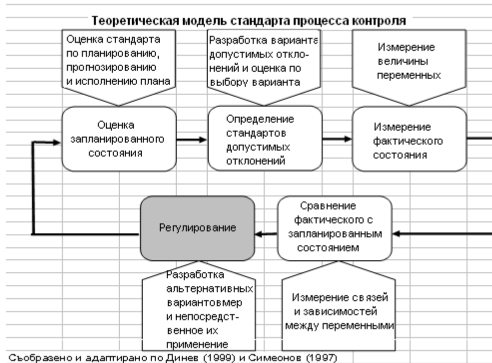
Рис.6. Теоретическая модель стандарта процесса контроля

Анализ, контроля, как функции управления, не будет завершен, если в него не включить периметра его действий и не рассматривать его связь с другими видами контроля, действующими и регулируемыми деятельностью любой организации. Корни контроля, как функции управления, могут быть обнаружены еще в ранних образцах управленческой мысли 20 , причем каждый следующий образец все больше обогащается и развивается значением контроля в содержательном и функциональном смысле. Сама его сущность и организованность, как набор формирующих его этапов, их расположение и протекание во времени оформляют его как процесс, посредством которого менеджеры могут выяснить когда ресурсы приобретаются и используются эффективно и результативно для достижения целей организации. 21 Совокупность действий по развитию контроля, как функции управления, протекающая в виде процесса, является логически организованной последовательностью.