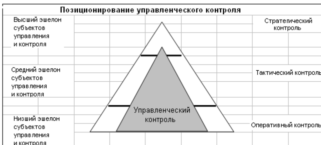
Рис.7. Позиционирование управленческого контроля в системе

Определенная группа ученых 24 , занятых разработкой идеи управленческого контроля, как содержательным, так и структурным его совершенствованием, определяют управленческий контроль, как: Организационная система поиска и накопления информации, отчетности и обратной связи, созданная для устанавливать факт, что организация адаптируется к изменениям среды ее существования, что деловое поведение работников определяется по критериям, связанным с определенными подцелями, так, что разница между ними может быть устранена или скорректирована.