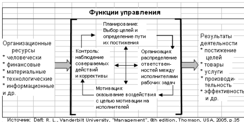
Рис.3. Функции управления

Другая группа специалистов, рассматривая эволюцию человеческого общества, связывает его с развитием и совершенствование определенных общественных организаций и структур, предлагает следующее определение: “управление - это целенаправленный и эффективный процесс достижения целей организации посредством планирования, организации, мотивации и контроля над ресурсами организации” 13 . Существенным моментом в этом случае является сочетание основных управленческих функций - планирования, организации, мотивации и контроля с эффективным и рациональным достижением реальных целей организации.