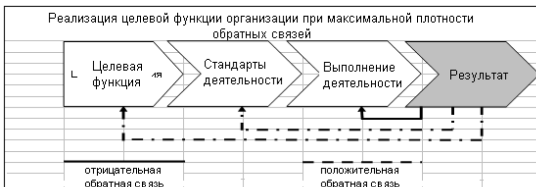
Рис.5. Схема реализации целевой функции организации

зависимостями, которые характеризуются тем, что результаты предыдущих действий, воздействуют на последующее функционирование управляемой системы.