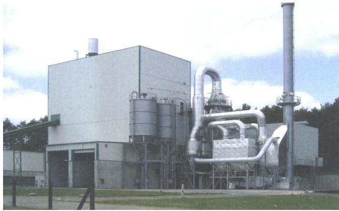
Рис.2. Електростанція в Вільмерсдорфі (Німеччина) на відходах деревини

Приймаючи до уваги пряму залежність між собівартістю виробництва електроенергії та вартістю первинного палива, приходимо до висновку про переваги використання у автономній електроенергетиці різноманітних недорогих відходів. Слід наголосити, що використання деяких відходів, що містять небажані включення, таких як ТПВ та мули каналізаційних стоків, має насамперед ліквідаційне спрямування. Енергетичний ефект в цьому випадку є хоч і значним, але другорядним. Про масштабність виробництва електричної і теплової енергії з ТПВ свідчать дані 2014 року Європейської конфедерації «Відходи в енергію» (CEWER – Confederation of European Waste to Energy Plants) [12].