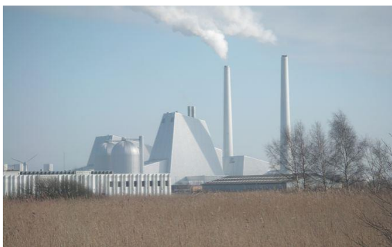
Рис.1. Загальний вигляд вугільної електростанції, переведеної на використання біомаси у м. Аведор, Данія [9, с.8].

В Європі виробництво електроенергії та СНР з використанням біомаси продовжує набувати поширення. Так, вже у 2016 році найбільша вугільна електростанція Данії повністю переведена на використання біомаси у вигляді деревинних пелет та соломи (рис.1).