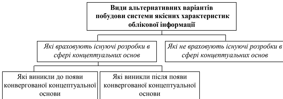
Рис. 1. Класифікація альтернативних варіантів побудови системи якісних характеристик облікової інформації

Виходячи із запропонованої класифікації (рис. 1) всі існуючі підходи до удосконалення структури якісних характеристик облікової інформації можна проаналізувати в контексті їх співвідношення із концептуальними основами, що розроблялись FASB та IASB або щодо конвергованої концептуальної основи. Ті альтернативні підходи, які враховують існуючі розробки в сфері концептуальних основ, є більш формалізованими, оскільки одразу можна визначити їх змістовне наповнення в контексті традиційної структури або ієрархії якісних характеристики, що реалізовані в концептуальній основі. Місце інших пропозицій дослідників, що не пов'язані із ієрархією якісних характеристик облікової інформації із концептуальних основ, визначити досить складно, що перешкоджає їх використанню для удосконалення якісного рівня національної облікової системи.