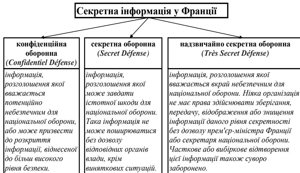
Рис. 1. Класифікація секретної інформації у Франції

У Франції секретною є інформація оборонного значення, яка за ступенем секретності поділяється на 3 рівні (рис. 1.) [2].