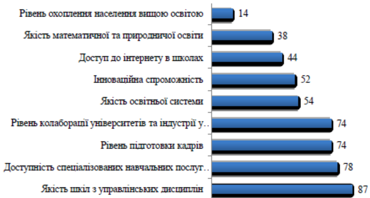
Рис. 2-Місце України в рейтингу глобальної конкурентоспроможності 2015-2016 рр. за складника «Вища освіта і професійна підготовка»

Незважаючи на високі позиції України за рівнем охоплення населення вищою освітою (14-те місце зі 140 країн, після Греції, США, Фінляндії, Німеччини та ін.), її якість залишається невисокою (54-те місце), що йде всупереч кількісним показникам (Рис. 2). За наведеним рейтингом найменш розвиненою в Україні є сфера управлінських шкіл (менеджменту, бізнес-шкіл), що призводить до нестачі висококваліфікованих управлінців і неефективності управлінських процесів. Показники професійної підготовки під час роботи вказують на низьку фаховість кадрів і відсутність постійного підвищення кваліфікації та навчання впродовж життя [3].