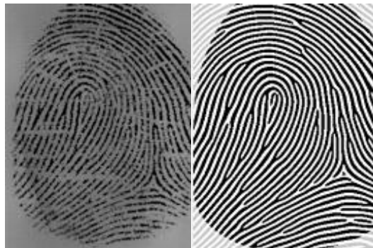
Рис. 5 Приклад відбитку пальця, обробленого фільтром Габора.

Тому при підборі значень \delta_x і \delta_y намагаються знайти компроміс між ефективністю фільтра і відсутністю внесених фільтром спотворень. Як правило ці параметри підбираються емпіричним шляхом.