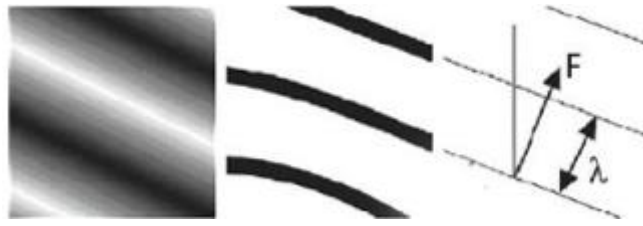
Рис. 4 Хвильове представлення ліній в осередку

Розрахунок частоти в точці з координатою (i, j) розраховується наступним чином: якщо \lambda - кількість пікселів між двома сусідніми гребенями в блоці розмірністю W \times W , і центр блоку - піксель з координатами (i, j) , то частота в даній точці буде розраховуватися як