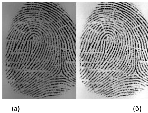
Рис. 1 Приклад вхідного (а) і нормалізованого (б) зображення образу відбитка пальця.

На Рис 1. наведено приклад вхідного і нормалізованого зображення