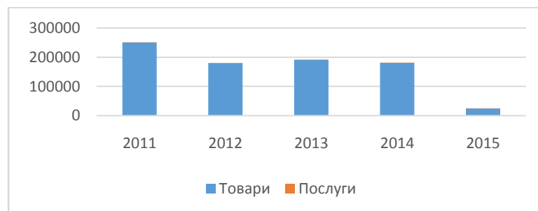
Рис. 2 Імпорт товарів і послуг Одеської області до Румунії

Що стосується імпорту Одеської області з Румунії, він має тенденцію до зниження та у 2015 році у порівнянні із 2014 роком зменшився на 156586,1 тис дол. США та становив 25119,4 тис. дол. США.