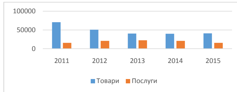
Рис. 3 Експорт товарів і послуг Одеської області до Молдови

56645,2 тис. дол. США. У 2015 році обсяг експорту товарів більш ніж утричі перевищував експорт послуг.