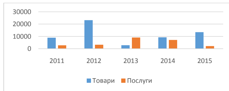
Рис. 1 Експорт товарів і послуг Одеської області до Румунії

За даними обласного управління статистики обсяг експорту товарів Одеської області до Румунії у 2015 році майже у сім разів перевищував експорт послуг. Загальний обсяг експорту зменшився у 2015 році у порівнянні із 2014 роком на 691,5 тис. дол. США та становив 15649,6 тис. дол. США.